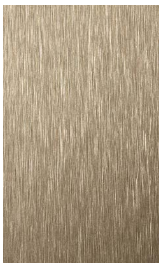
3902-GB Copper Brushed