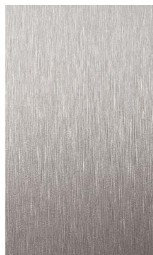
3900-GB Aluminium Brushed