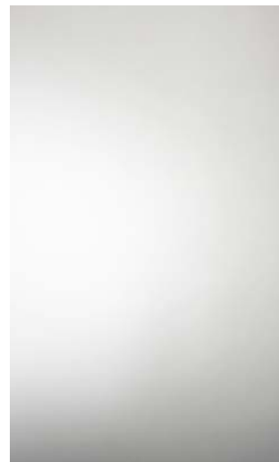
3907-HG Aluminium Gloss