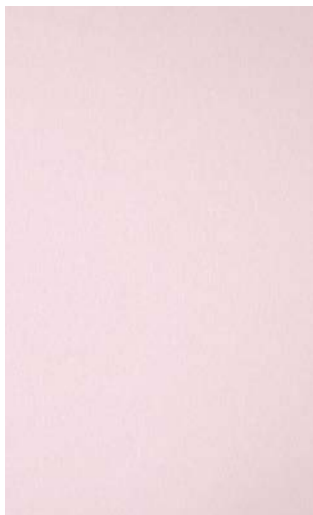
3917-FG Powder Matted