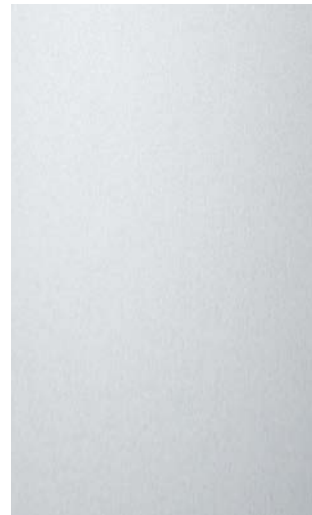
3905-FG Aluminium Matted