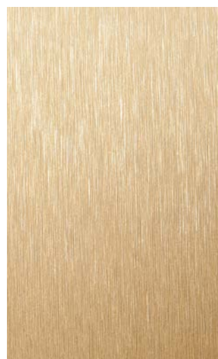
3901-GB Gold Brushed