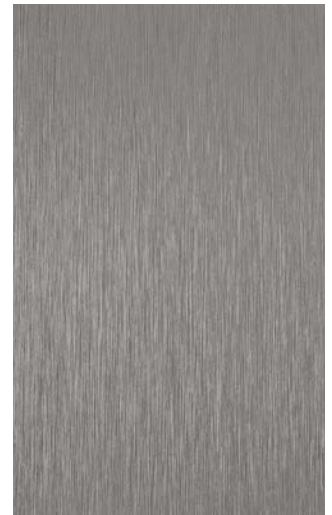
3906-TM Titanium Traceless Metal