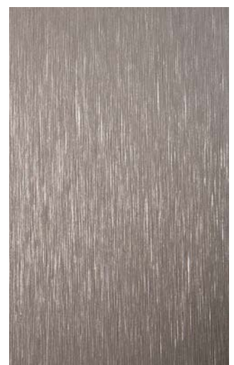
3903-GB Titanium Brushed