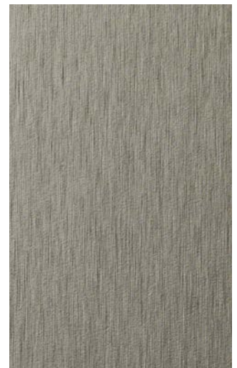
3951-TO Titanium Brushed Horizontal